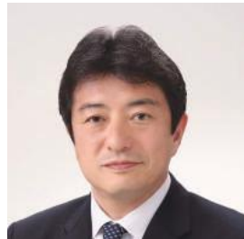
高野のりお▶ 府中市長 (6日 武蔵台)