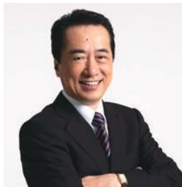
◀ 菅直人 衆議院議員 (5日 西原町)